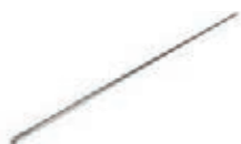
TUBE DE PROTECTION DE CABLE Acier zingué, Longueur 1 mètre diamètre 8 mm