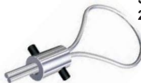
SERRE-CABLE ROND 2 serrages BTR - Acier zingué