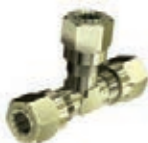
RACCORD UNION "Té" 6mm En laiton