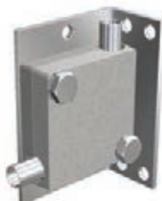
POULIE DE RENVOI SOUS CARTER