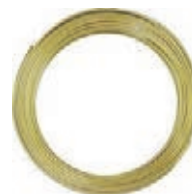
TUBE DE CUIVRE 6 mm Couronne de 25 mètres