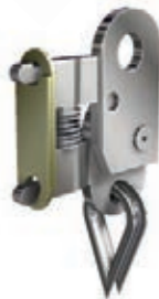
FUSIBLE DEMULTIPLIÉ 70°C