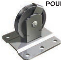
POULIE DE RENVOI DÉPORTÉE