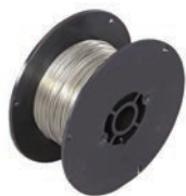
CABLE EN ACIER GALVANISÉ Diamètre 2,4 mm - Touret 100 m