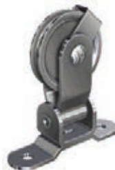
POULIE DE RENVOI ARTICULÉE