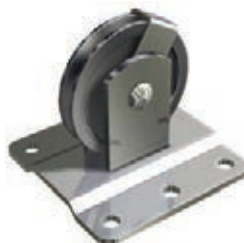
POULIE FIXE DE RENVOI